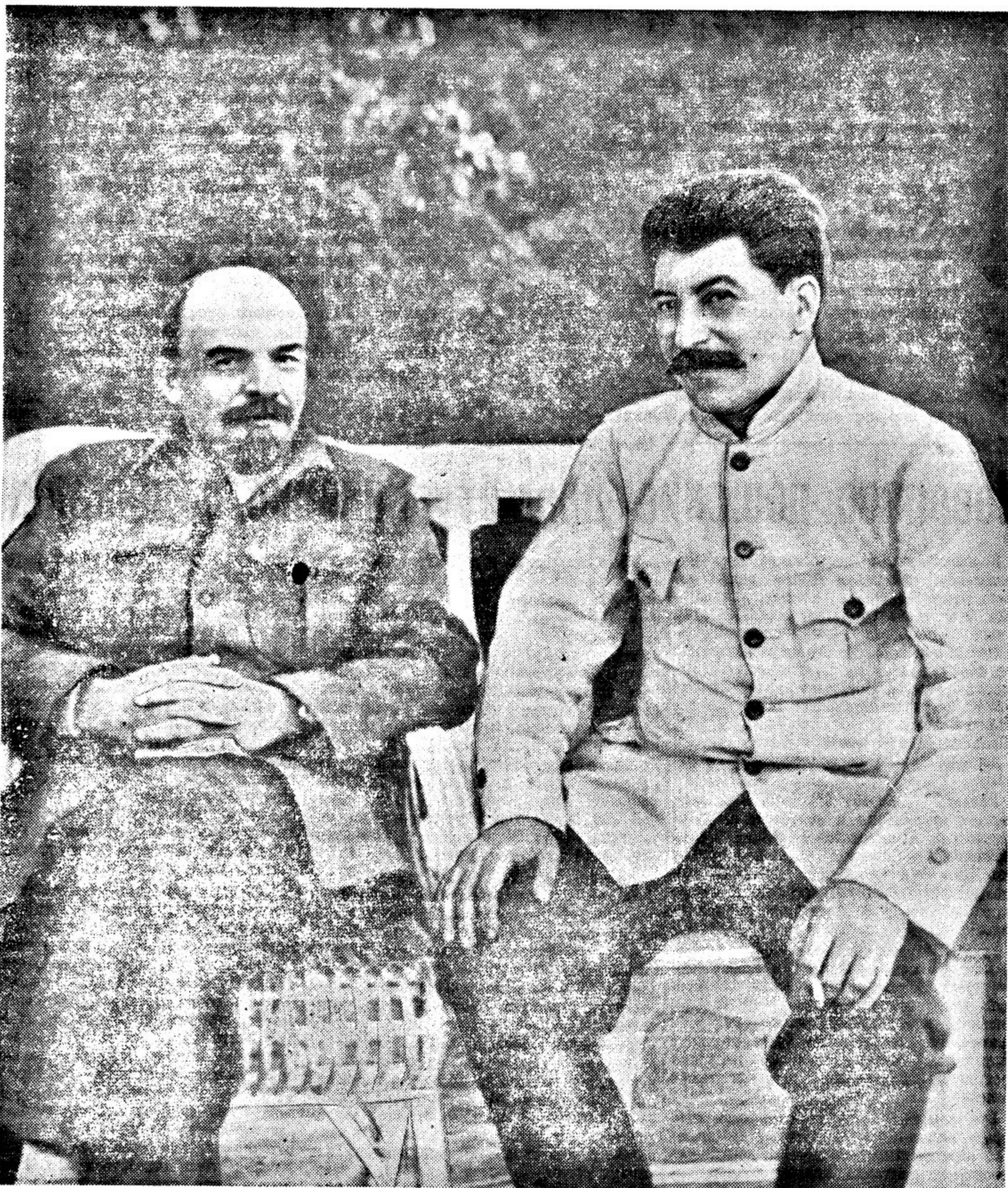
В. И. Ленин и И. В. Сталин в Горках